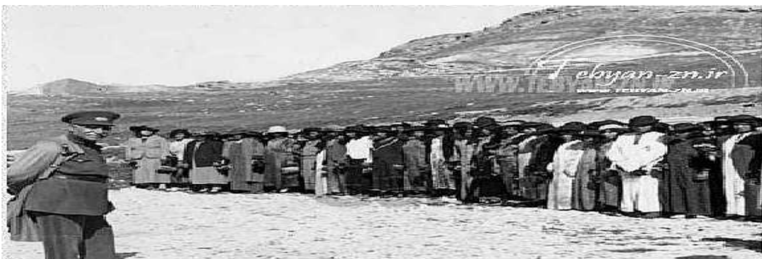
جمعی از زنان پس از کشف حجاب با لباس جدید در مراسم استقبال از رضا پهلوی